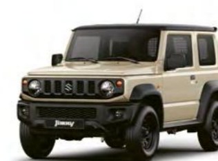
Chiffon Ivory Metallic/ Bluish Black Pearl Metallic