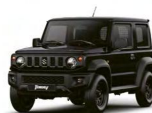
Bluish Black Pearl Metallic