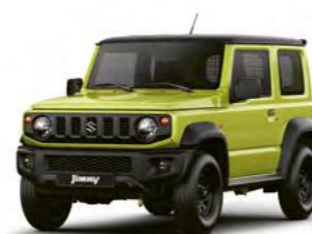
Kinetic Yellow/ Bluish Black Pearl Metallic

Gut möglich, dass Sie schon aus beruflichen Gründen gedecktere Farbtöne bevorzugen. Der Jimny bietet Ihnen dafür eine breite Auswahl. 2 der 6 Lackierungen sind außerdem mit schwarz abgesetztem Dach zu haben. Mit Kinetic Yellow zum Beispiel gibt das Ihrem Fahrzeug eine sehr expressive Note. An dieser Stelle lässt der Jimny mal alle „Nutzfahrzeug“-Vernunft phantasievoll hinter sich. Warum auch nicht.